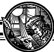
СХЕМА ПОАСПЕКТНОЙ ХАРАКТЕРИСТИКИ ДИССЕРТАЦИИ: ПРАВИЛА, РЕКОМЕНДАЦИИ, ПРИМЕРЫ