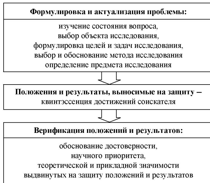
Схема представления результатов научного исследования при защите диссертации

Согласно логике разворачивающегося исследования и рефлексии над ним post factum , объект исследования резонно упомянуть первый раз, завершая анализ состояния вопроса и обосновывая актуальность темы диссертации. Далее формулируется цель работы. Целеполагание (с учётом научной конъюнктуры и природы объекта исследования), в свою очередь, развёртывает задачи, решение которых требует от исследователя грамотно выбрать (создать) адекватные методы исследования. В свете методов объект даёт свою «тень» – предмет исследования.